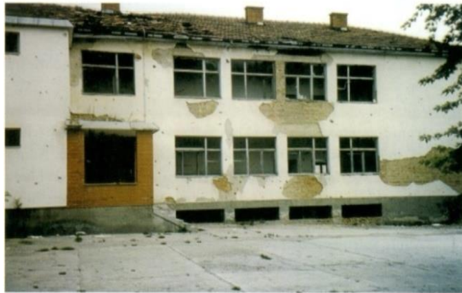
Školska zgrada 1996. godine

Škola ni u teškom ratnom periodu nije prestala sa radom, nastava je organizirana uglavnom, u mektebima i privatnim kućama u mjestima u okolini Kalesije.